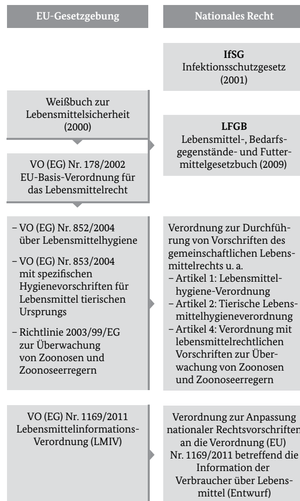
Abbildung 1: Übersicht über die rechtlichen Rahmenbedingungen in der Gemeinschaftsverpflegung

Außerdem wird die Anwendung einschlägiger DIN-Normen (zum Beispiel 10508 Temperaturen für Lebensmittel, 10526 Rückstellproben in der GV, 10524 Arbeitskleidung, 10514 Hygieneschulung) empfohlen. 42